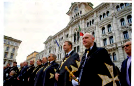
Der St. Georgs-Orden mit Karl Habsburg-Lothringen (Mitte) zu Besuch in Triest